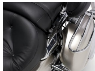
ВЕРХНИЕ НАПРАВЛЯЮЩИЕ ДЛЯ СЕДЕЛЬНЫХ СУМОК