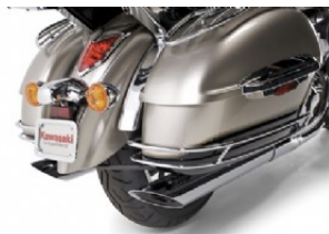
БОКОВЫЕ НАПРАВЛЯЮЩИЕ ДЛЯ БАГАЖНИКА